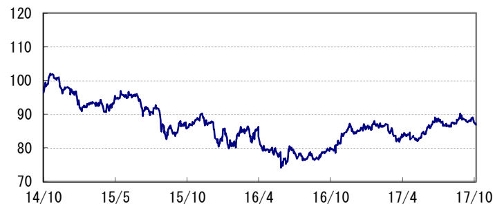
<為替推移 円/豪ドル(参考)>

※当レポート中の各数値は四捨五入して表示している場合がありますので、それを用いて計算すると誤差が生じることがあります。