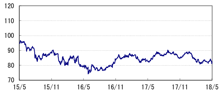
<為替推移 円/豪ドル(参考)>

※当レポート中の各数値は四捨五入して表示している場合がありますので、それを用いて計算すると誤差が生じることがあります。