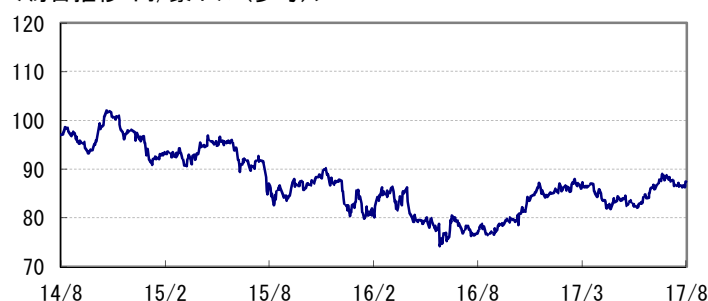
<為替推移 円/豪ドル(参考)>

※当レポート中の各数値は四捨五入して表示している場合がありますので、それを用いて計算すると誤差が生じることがあります。