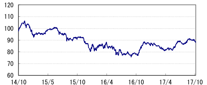
<為替推移 円/加ドル(参考)>

※当レポート中の各数値は四捨五入して表示している場合がありますので、それを用いて計算すると誤差が生じることがあります。