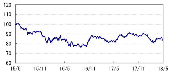
<為替推移 円/加ドル(参考)>

※当レポート中の各数値は四捨五入して表示している場合がありますので、それを用いて計算すると誤差が生じることがあります。