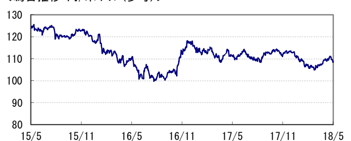
<為替推移 円/米ドル(参考)>

※当レポート中の各数値は四捨五入して表示している場合がありますので、それを用いて計算すると誤差が生じることがあります。